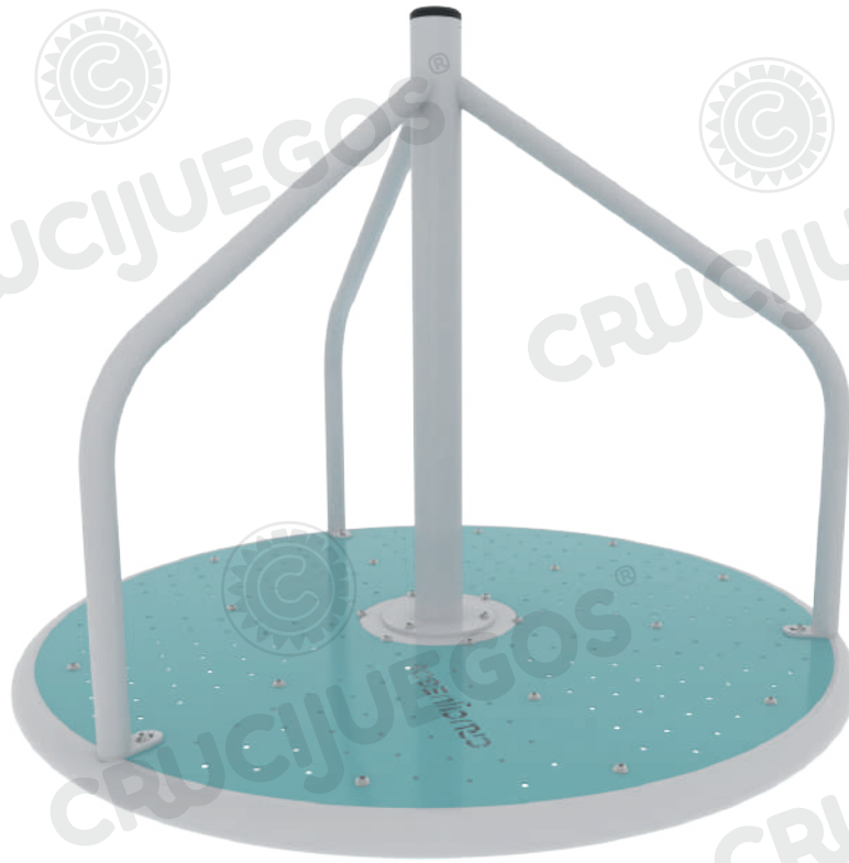
Imagen referencial. Para más información ingrese a www.insumos.crucijuegos.com